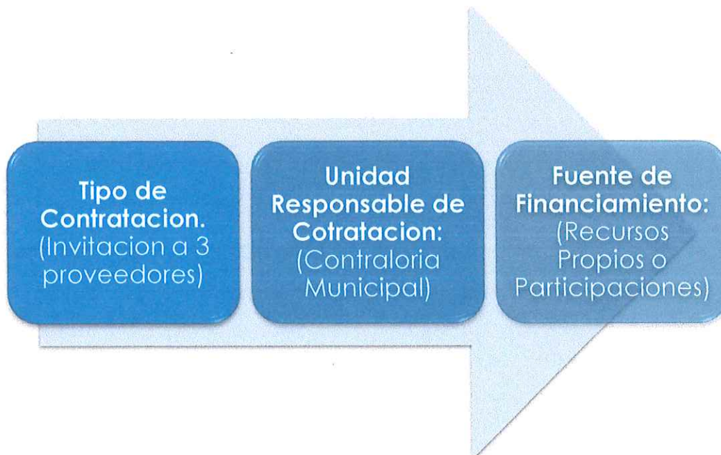
Tabla 5.- Metodología de contratación del Plan de Desarrollo Municipal, ejercicio fiscal 2021.

Los programas presupuestarios del ejercicio 2021 están vinculados a los ejes de Gobierno del Plan de Desarrollo Municipal 2018-2021 de Altepexi, por lo que será el Informe Final del Programa Presupuestario la herramienta necesaria para emitir dicho reporte.